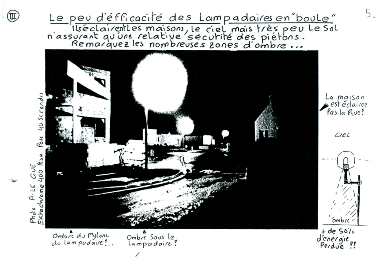
Fig. 1. Extrait d'une documentation de sensibilisation produite par les défenseurs du nocturne (source : archives de la Société astronomique de Bourgogne, Dijon, 1994).

que de préconisations techniques qui sont autant de ressources pour les autres associations nationales moins structurées. Elle a notamment essayé sa méthode de production participative d'une expertise sur la nocturnité, entendue comme une ressource cognitive mobilisée par différents acteurs, poussés par des motifs pluriels (Dumoulin et al. , 2005) « en réponse à des situations confuses appelant une décision d'attribution ou de validation » (Trépos, 1996). Accueillant et formalisant les connaissances vernaculaires et amateurs, cette expertise infuse la production de savoirs scientifiques et institutionnels qui entretiennent et publicisent la controverse. Cette production de nouveaux savoirs scientifiques est validée suivant les canaux habituels de publication et de confrontation aux pairs. Elle légitime en retour cette forme de production participative de l'expertise, les questions de l'indépendance de l'expertise, de son