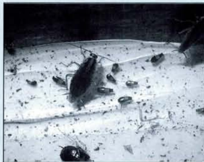
La blatte germanique, Blattella Germanica L.