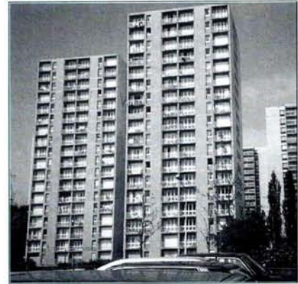
Immeubles ayant fait l'objet de l'étude, situés à Rennes.

Depuis novembre 1991, date de son installation, elle explique qu'elle a lutté pour s'installer véritablement dans cet habitat. En effet, ses amis n'ont pas tous réagi favorablement à la vue du quartier : « Les gens n'étaient pas habitués à nous voir évoluer dans un cadre comme ici, c'est là qu'on fait le tri de ses amis. » « C'est pareil pour l'immeuble. Les gens quand ils rentrent ici, me disent : tu as vu où tu habites, tu as vu comment ça sent, tu as vu de quelle couleur les gens sont. Moi c'était clair, je leur ai dit : il y a des cafards, si ça vous gêne, vous partez, si ça ne vous gêne pas, vous restez. » Mais elle a du lutter également contre l'intolérance et l'indifférence des gens du voisinage : « C'est vrai qu'au départ j'avais pris un peu l'habitude de dire : finalement, il ne faut pas regarder ce qu'il y a autour, il faut rentrer chez soi, s'enfermer. C'est chez toi que ça compte, c'est pas à l'extérieur et puis non, en fait il y a des gens très valables ici. C'est vrai qu'il faut faire le tri mais ce qui choque le plus, c'est l'intolérance : c'est toujours la faute à l'autre, ils ne